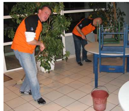
Certaines boivent, d'autres nettoient ...