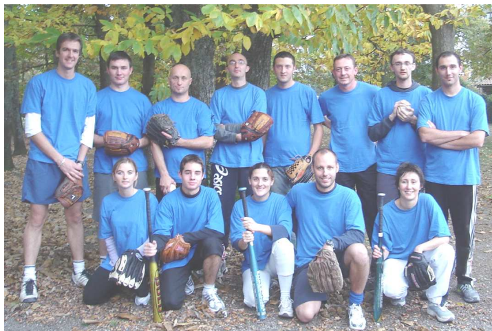
L'équipe de la première finale des ATOMIXTES de Braud et St Louis

L'exploit des Atomixtes fera date dans le softball Aquitain Blayais. Les tout nouveaux joueurs et joueuses de Braud et St Louis, ont créés la sensation lors du premier tournoi hivernal 2007. En battant, dès le premier match de poule l'expérimentée équipe de Pessac qui comptait dans ses rangs des joueurs récemment titrés champions de France de Soft Masculin. Un match nul contre Toulouse assurait directement la qualification pour la finale. Les Atomixtes « lâchent » le dernier match de poule contre leurs futurs adversaires en finale, les Pumas de PAU. La finale sera difficile pour nos valeureux Atomixtes, fatigués par une dure journée pleine d'émotion. Les Pumas, largement supérieurs, physiquement et techniquement s'imposent 14 à 4. Ce premier tournoi restera une grande réussite pour le club tant du point de vue sportif que convivial. Merci les Atomixtes de nous faire vivre de telles émotions. Ce n'est qu'un début, l'avenir nous appartient !