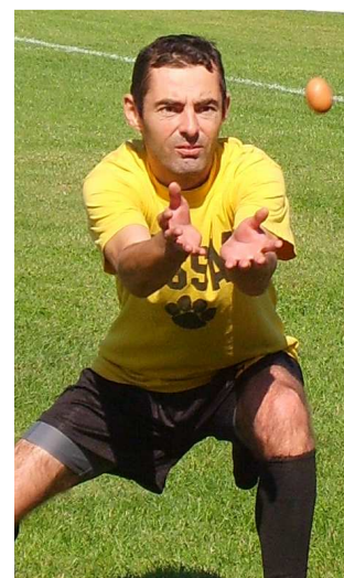
Un 1 er Décasoft qui a tenu toutes ses promesses. Merci à tous. Vivement l'année prochaine !