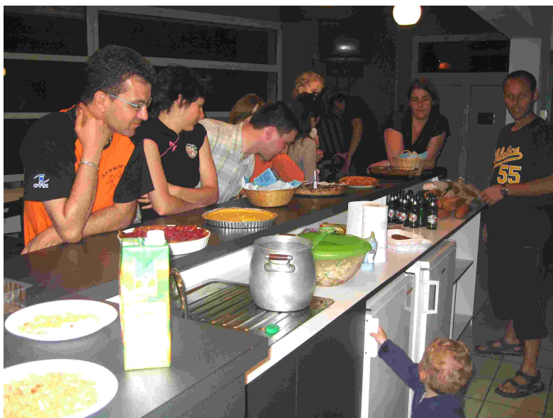
Repas des 1 ans du club. Merci à tous les cuisiniers et cuisinières.