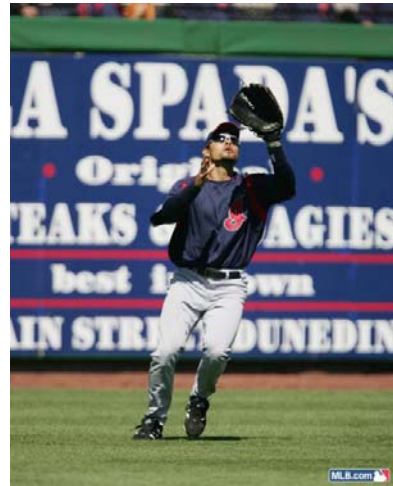
2. Placement de face