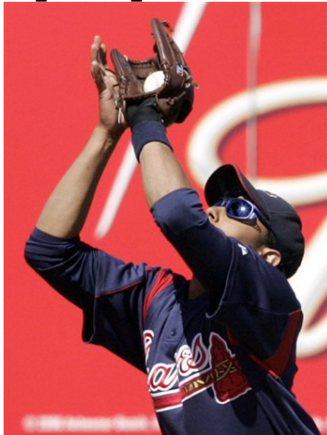
3. Attraper - position des bras