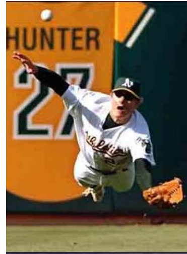
4. Balle en bout de course